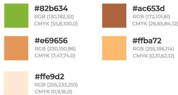
Gambar 1. Warna Dasar

Perancangan ini menghasilkan desain logo Usahabaru yang menggunakan dua warna utama. Warna tersebut adalah warna hijau dan coklat yang disesuaikan misi dan visi dari Usahabaru. Toko Usahabaru memiliki visi untuk menjadikan segala kebutuhan konsumen terpenuhi dengan dan memprioritaskan kebutuhan konsumen dan juga mengutamakan mutu pelayanan dan kepuasan konsumen. Warna hijau berdekatan dengan warna tumbuhan yang banyak dimanfaatkan masyarakat sehingga dapat menggambarkan kedekatan masyarakat dengan Usahabaru yang berupaya untuk memenuhi kebutuhan masyarakat dengan mudah. Warna coklat dipilih untuk menyeimbangkan warna hijau yang cenderung terang sehingga nilai keseimbangan pada warna dapat tercapai.