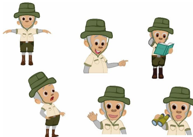
Gambar 3. Karakter/figur