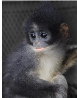
Gambar 2. Surili

Pembuatan karakter utama menggunakan karakter “Park Ranger” berupa karakter primata yang bernama Zuri yang di angkat dari nama primata “Surili” akan menjadi pemandu/guide yang akan menemani pembaca dan menjelaskan deskripsi dari binatang. Penggunaan baju safari di artikan sebagai penjaga hutan