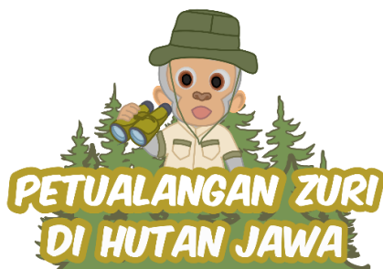
Gambar 1. Logo

Dalam perancangan buku ilustrasi harus memiliki identitas yang jelas agar dapat dengan mudah diingat oleh anak-anak yang membaca buku ilustrasi tersebut. Logo dibuat dengan menggabungkan unsur tulisan dengan gambar.